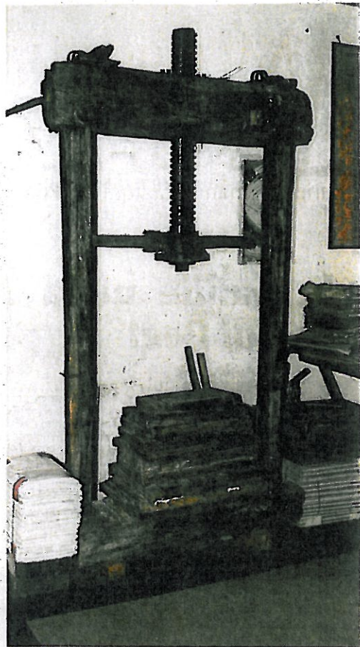
Uno storico torchio conservato al museo della carta di Mele

con quella delle cartiere che fino a qualche anno fa erano perfettamente funzionanti. Oggi alcune sono state trasformate in abitazioni. A ricordo di quella secolare attività resta la cartiera-Museo di Acquasanta dove volontari spiegano ai visitatori tutta la storia della fabbricazione. Inoltre, tra le varie testimonianze, restano la bellezza dell'Oratorio di Sant'Antonio Abate con la statua restaurata, l'antica Neviera o il Santuario di Acquasanta proprio accanto alle Terme che riapriranno tra poco.